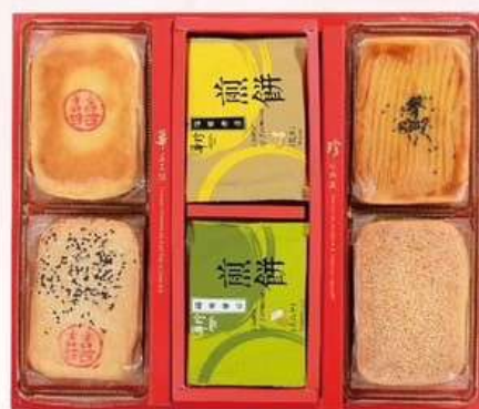
緣定華麗B 10兩喜餅4入 煎餅10入