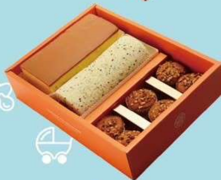
親親寶貝 B 原價750元 特價600元