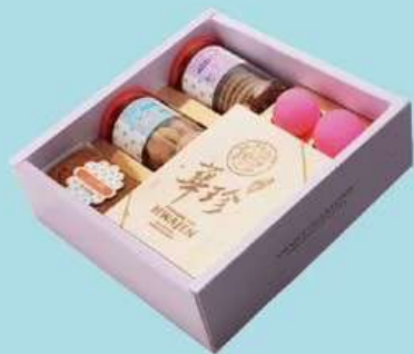
幸福小花園 E 原價500元 特價460元

手工曲奇餅乾2罐(口味任選) 法式小雪藏1條(口味任選) 紅蛋2顆 香菇鮭魚魷魚油飯12兩