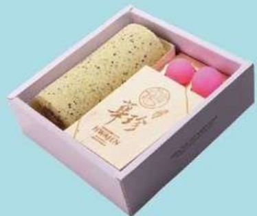
幸福小花園 G 原價450元 特價380元