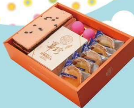
親親寶貝 A 原價820元 特價650元