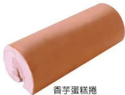
香芋蛋糕捲 精選台灣芋頭 口感鬆軟、香氣濃郁！ 原價320元 特價250元