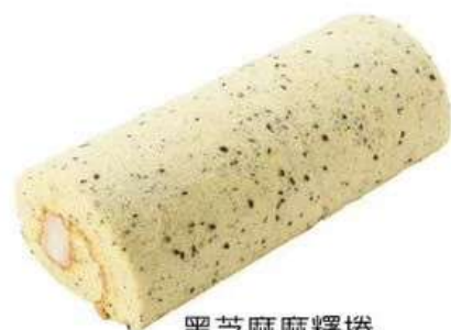
黑芝麻麻糬捲 鬆軟的養生黑芝麻蛋糕 Q彈麻糬合而為一 原價280元 特價220元