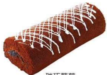
瑞巧藍莓 酸甜藍莓醬、微苦巧克力 原價280元 特價220元