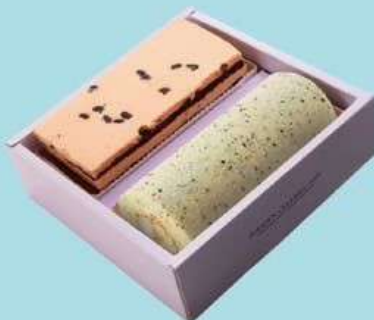
幸福小花園 H 原價650元 特價500元