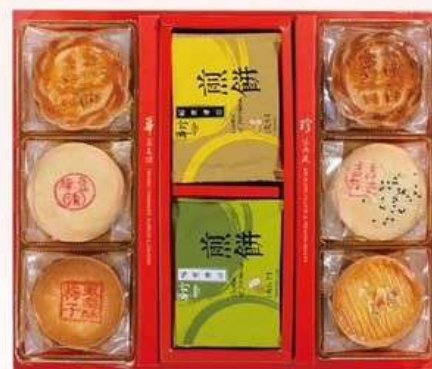
緣定華麗C 5兩喜餅6入 煎餅10入