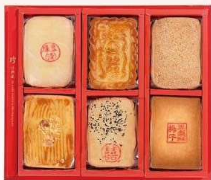
緣定華麗A 4斤6式喜餅6入