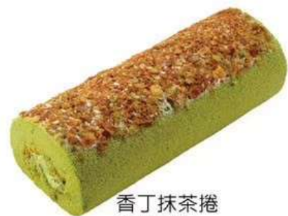
香丁抹茶捲 清新抹茶 香丁柑橘多酚(PMF) 原價280元 特價220元