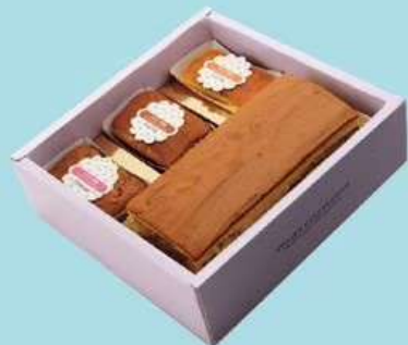
幸福小花園 F 原價510元 特價390元

手工曲奇餅乾2罐(口味任選) 法式小雪藏1條(口味任選) 紅蛋2顆 香菇鮭魚魷魚油飯12兩