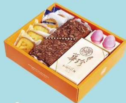
親親寶貝 C 原價700元 特價560元